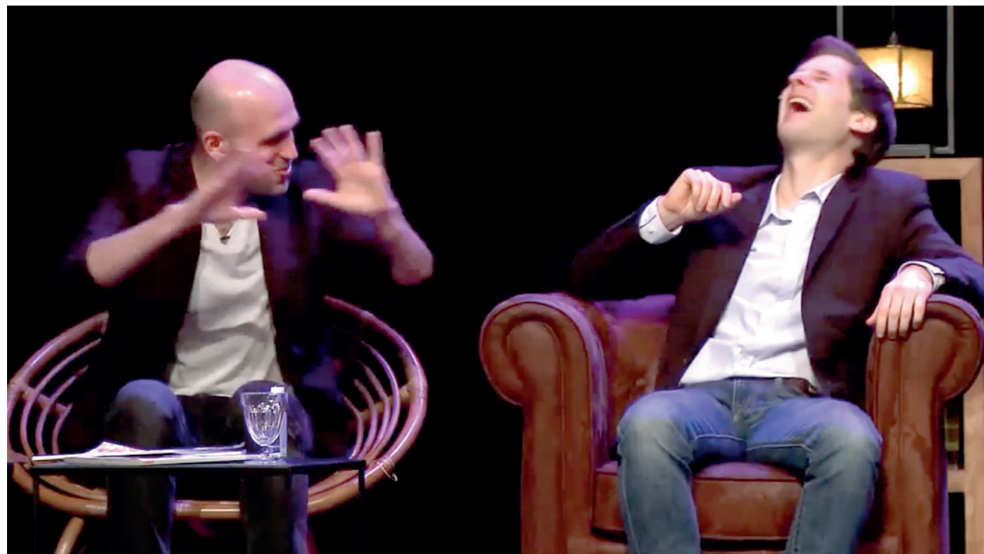
Un plateau d'artistes déjantés qui n'épargnent personne. Tous les travers quotidiens du couple sont passés en revue par des humoristes survoltés !

Réservez votre soirée, Seine Ouest Habitat et Patrimoine vous invite à un spectacle à l'occasion de la nouvelle année !