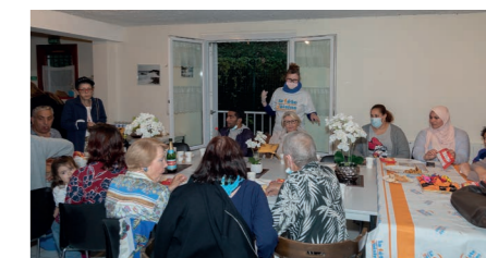
Résidence Bois Vert